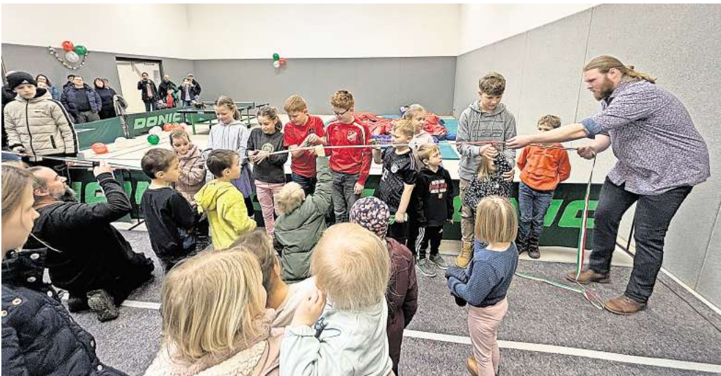
Mit sportlichen Angeboten wurde die Sporthalle eingeweiht.