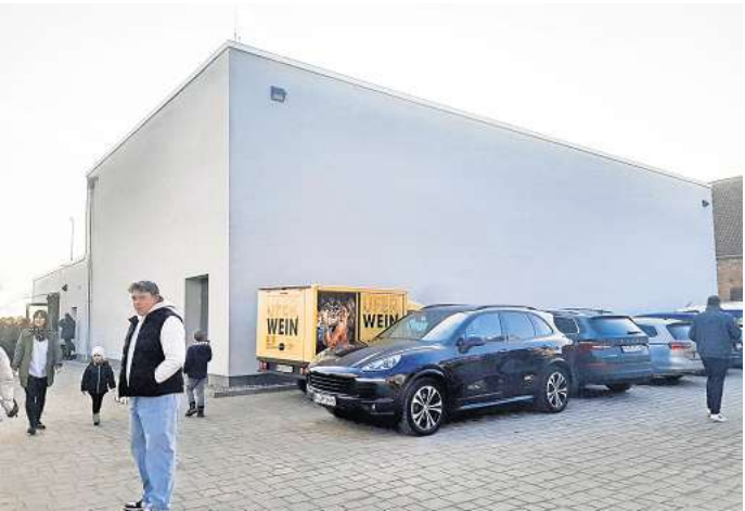
Nüchtern und ohne Fenster: Der Neubau der Turnhalle Dolgen.

dratmeter, davon nimmt das Spielfeld 259 Quadratmeter ein. Die Halle ist mit einer lichten Höhe von fünfeinhalb Metern deutlich höher als ihre Vorgängerin – um dort auch Volleyball anbieten zu können. Unter dem Parkplatz vor der Halle sind jetzt zudem zwei Lösch tanks mit 110.000 Litern Wasser für die Feuerwehr eingelassen. Nötig wurde der Neubau dadurch, dass die alte Halle an der Grenze ihrer Sanierungsfähigkeit angelangt war. Das Besondere an der Vorgängerin, wie Ed-