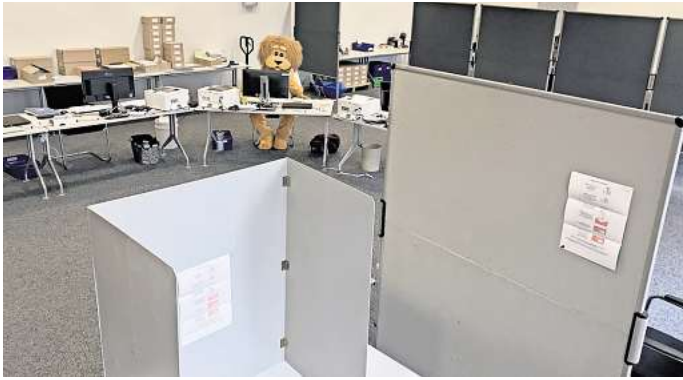
Sehndes Maskottchen Kali sitzt Probe im Briefwahllokal: Die Briefwahlunterlagen können auch gleich im Rathaus ausgefüllt und abgegeben werden.

Alternativ besteht auch die Möglichkeit, persönlich im Briefwahllokal im Rathaus wählen. Dafür sind die Wahlbenachrichtigungskarte sowie der Personalausweis oder Reisepass erforderlich. Das Briefwahllokal befindet sich im Ratssaal, Eingang Nordstraße 19. Es ist zu folgenden Zeiten geöffnet: Montag bis Mittwoch von 9 bis 12 Uhr, Don-