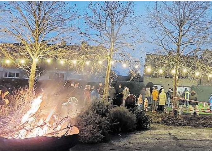
In Bilm wird Knut gefeiert.