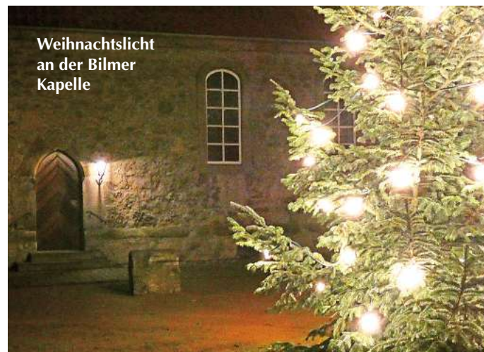
Weihnachtslicht an der Bimler Kapelle