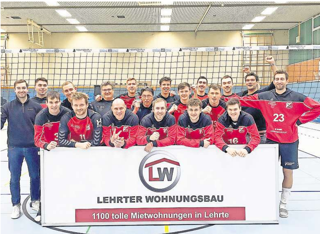
Die America Unlimited Volleys Aligse als stolze Sieger über den ETV Hamburg.

wehr den Satz bestimmend von vorne weg spielte, unterliefen den Gastgebern zahlreiche Eigen- und Annahmefehler, sodass es zwischenzeitlich 19:11 stand. Die Aligser wechselten auf der Mittelblocker-Position: Steffen Barklage verließ das Feld, für ihn übernahm Steffen Bauerochse. Dank seiner hohen Angriffseffizienz entwickelte sich Bauerochse im weiteren Spielverlauf zu einem entscheidenden Faktor für den Sieg. Der vierte Satz gestaltete sich von Anfang an spannend. Nachdem die Aligser zunächst auf 17:13 davonziehen konnten, gleich der ETV anschließend wieder auf 17:17 aus, bevor Steffen Bauerochse an die Aufschlagslinie ging und den Spielstand auf 21:17 erhöhte. Die Gastgeber ließen sich den Satz nicht mehr nehmen und schafften somit den Satzausgleich und den erhofften Einzug in den Tiebreak. Im entscheidenden fünften Satz starteten die Aligser mit