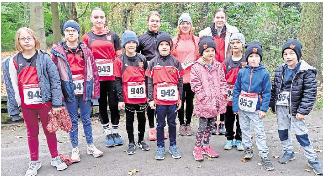
Läuferinnen und Läufer des MTV Rethmar vor dem Start.