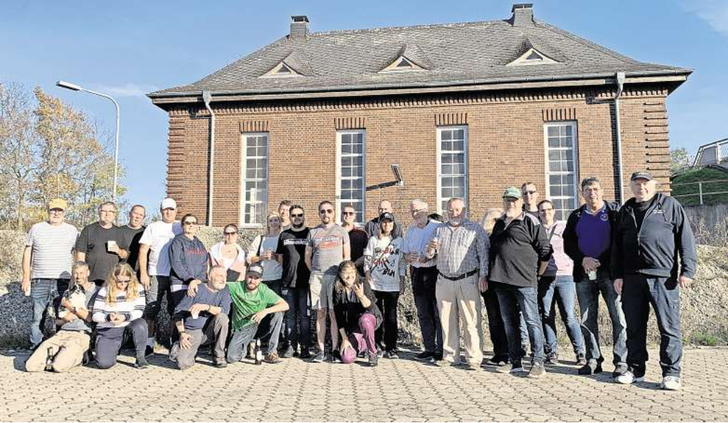
Saisonabschluss im Motorboot-Club an der Schleuse.

vereinseigene Sliprampe aus dem Wasser geholt werden. Das „Anbooten“ erfolgt jedes Jahr am ersten Wochenende im Mai. Die Saison beim MBC dauert dann rund fünf Monate und endet am letzten Wochenende im Oktober. Informationen zu Terminen und zum Ausbildungsangebot des MBC Sehnde werden unter www.motorbootclub-sehnde.de bereitgestellt. Zusätzlich können Anfragen über die E-Mail fahrschule@motorbootclub-sehnde.de und telefonisch unter 0176 34 34 45 62 gestellt werden.