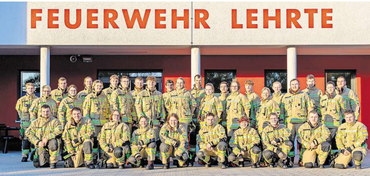
Nach erfolgreicher Ausbildung nun im aktiven Dienst: Einsatzkräfte der Ortsfeuerwehren.

Die ehrenamtlichen Einsatzkräfte sind damit ab sofort für den aktiven Einsatzdienst in den Ortsfeuerwehren qualifiziert. Bei der Prüfung am Wochenende wurden sowohl Grundlagen wie das Anlegen von Rettungs-