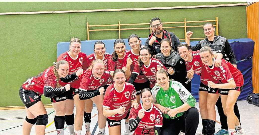
Die TVE-Handball-Damen feiern ihren Erfolg.

dende Durchbruch: Mit einem energischen 4:0-Lauf erkämpften sich die Spielerinnen die Führung. Einen großen Beitrag dazu lieferte auch der herausragende Rückhalt im Tor, auf den sich die Sehnderinnen während des ganzen Spiels verlassen konnten. Den gewonnenen Vorsprung gaben sie bis zum Schlusspfiff nicht mehr her. Mit einem Endstand von 21:18 sicherten sich die Sehnderinnen den verdienten Sieg und festigten damit ihre Position an der Tabellenspitze. Im Heimspiel gegen HV Barsinghausen II zeigten die zweiten TVE-Handball-Herren eine gute Leistung und holte sich einen verdienten 32:28-Erfolg. Besonders der Auftakt verlief vielversprechend: In den ersten Minuten stellte Torwart Marius Körper die Weichen für einen frühen Vorsprung, indem er einige wichtige Würfe der Gäste entschärfte. Dadurch konnten unsere Sehnder die Partie mit einem souveränen 6:0-Lauf eröffnen. Anschließend kamen die Gäste besser ins Spiel, die frühe Füh-