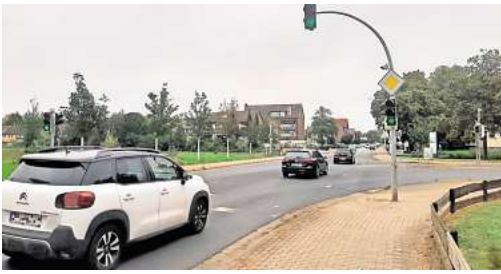
Grünes Licht für den geplanten Ringverkehr auf der Ahltenener Straße

ständiger ermitteln, sagte Nave. Die Instandsetzung der Westtangente werde die Stadt etwa eine halbe Million Euro kosten, erklärte er. Man müsse dabei aber auch berücksichtigen, dass die Kommune dann nicht mehr für die teure Unterhaltung der beiden Brücken über die Bahn und die Autobahn zuständig sei. „Das ist für die Stadt ein Vorteil.“ Die Vereinbarungen mit dem Land seien geschlossen, betonte der Verkehrsexperte der Stadt. Trotzdem müsse die Umsetzung noch ein wenig warten – das liege am Fachkräftemangel. „Das technische Personal im Rathaus ist rar und der-