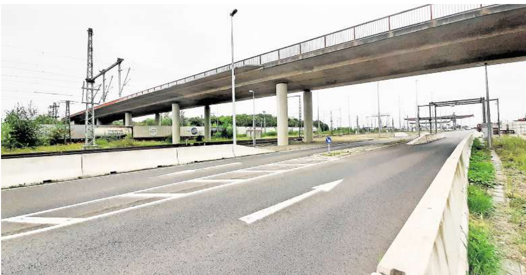
Weniger Kosten für die Stadt: Für den Unterhalt der Brücken über die Bahn und die A2 ist zukünftig das Land zuständig.

kommen, möchte die Verwaltung dauerhafte Veränderungen in der Straße vornehmen. „Da macht es wenig Sinn, wenn jetzt die Straße saniert wird und wir in ein paar Jahren sagen: Das brauchen wir nicht“, erklärte Niklas Nave vom Sachgebiet Straßen und Ingenieurbauten im Ausschuss. Inzwischen haben sich Stadt und Land auf eine Vorgehensweise geeinigt. Die beiden Parteien haben eine Vereinbarung geschlossen, die den Tausch der Ahltenener Straße gegen die Westtangente auf den Weg bringt. Darin wird festgelegt, dass die Stadt die Westtangente komplett saniert. Das Land hingegen erneuert lediglich die Stücke der Ahltenener Straße zwischen Westtangente und Westring sowie zwischen Alter Bahnhofstraße und Berliner Allee. Das Geld, das das Land gegenüber einer Komplettsanierung einspart, bekommt die Stadt auf ihr Konto eingezahlt. Wie groß diese Summe ist, müsste noch ein Sachver-