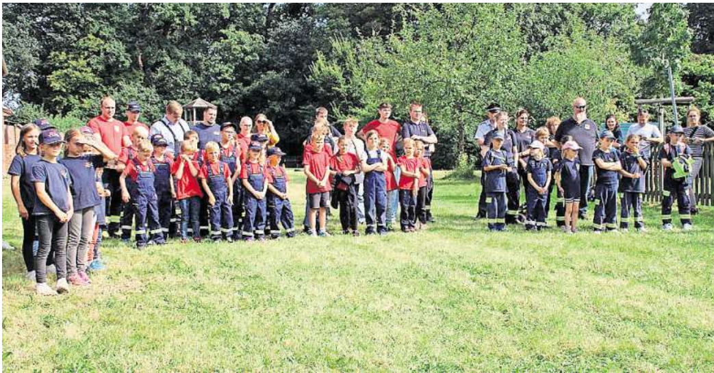
Teilnehmer der Kinder-Feuerwehren bei der Siegerehrung auf der Bürgerweise.

BOLZUM-WEHMINGEN. Anlässlich ihres 25-jährigen Bestehens hatte die gemeinsame Kinderfeuerwehr der Ortsfeuerwehren Bolzum und Wehmingen zu einer Spiele-Olympiade eingeladen. Die Sehneder Stadt-Kinder-Feuerwehr hat insgesamt neun Kinder-Feuerwehren. Sechs Gruppen aus fünf Kinder-Feuerwehren aus dem Stadtgebiet haben am Wettkampf auf der Bürgerweise am Wehminger Feuerwehrgerätehaus teilgenommen. Nach einer kurzen Begrüßung durch die Kinder-Feuerwehrwartin Stefanie Worm konnten die Spiele beginnen. An acht Stationen galt es verschiedene Aufgaben im Team zu bewältigen. Neben einem Feuerwehr-Memory und Wasserflaschen-Kegeln mussten die Kinder an einer weiteren Station Schätzfragen beantworten und unterschiedliche Tierfiguren erasteten. Besonders herausfordernd war die Station „Parcours“, ein mit Feuerwehrleinen abgesteckter Hindernisparcours, der zu zweit und mit verbundenen Beinen durchlaufen werden musste. Für die Verpflegung der Teilnehmer und Gäste war mit Gegrilltem, Pommes, Kuchen Spenden von Eltern und Getränken gesorgt. Für die Siegerehrung sind Stadt-Kinder-Feuerwehrwartin Birgit Bettmann, Stadtbrandmeister Jochen Köpfer, sowie sein Stellvertreter Sven Grabbe und weitere Gäste aus den Ortsfeuerwehren dazu gekommen. Der Stadtbrandmeister überbrachte Grußworte und gratulierte dem Nachwuchs aus Bolzum und Wehmingen. Danach bedankten sich Stefanie Worm und der stellvertretende Kinder-Feuerwehrwart Kars-