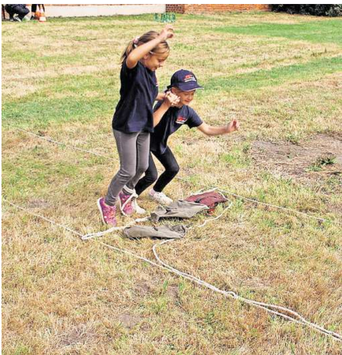
Anforderungen im Parcours wurden spielerisch gemeistert.

ten Gratz bei den angetretenen Kinder-Feuerwehren für die Teilnahme und bei den Kameraden und Kameradinnen der Feuerwehren Bolzum und Wehmingen für die gemeinsame Ausrichtung der Jubiläumsveranstaltung. Die erreichte Punktzahl der Gruppen an den Stationen lag nah beieinander und somit gab es insgesamt nur vier Endplatzierungen. Platz vier belegte die Gruppe Müllingen-Wirringen 1 und den dritten Platz die Gruppe Rethmar 1. Auf dem zweiten Platz landeten neben den Gruppen Müllingen-Wirringen 2 und Rethmar 2 die Gruppe der Gastgeber aus Bolzum-Wehmingen. Die gemischte Gruppe der Kinderfeuerwehren aus Höver und Wassel erreichte den ersten Platz und gewann somit die Jubiläumsolympiade, so der Bericht von Feuerwehr-Sprecher Christopher Wolpert.