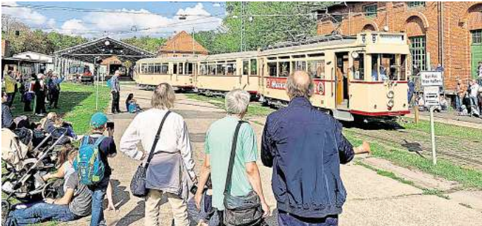
Für den Entdeckertag sind im Straßenbahn-Museum viele Attraktionen vorbereitet.

Tram-Parade und viele Attraktionen am 8. September