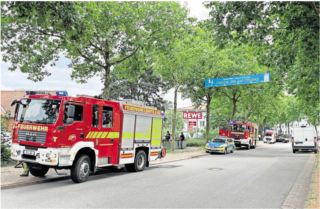
Einsatzstelle im Südring am 5. August.

mal der betroffene Kellerbereich keinerlei Abluftöffnungen hatte. Der Techniker ging im Anschluss auf Lecksuche, begleitet von einem Trupp unter Atemschutz. Gegen 14.30 Uhr war der Feuerwehreinsatz mit vier Fahrzeugen und 21 Einsatzkräften beendet.