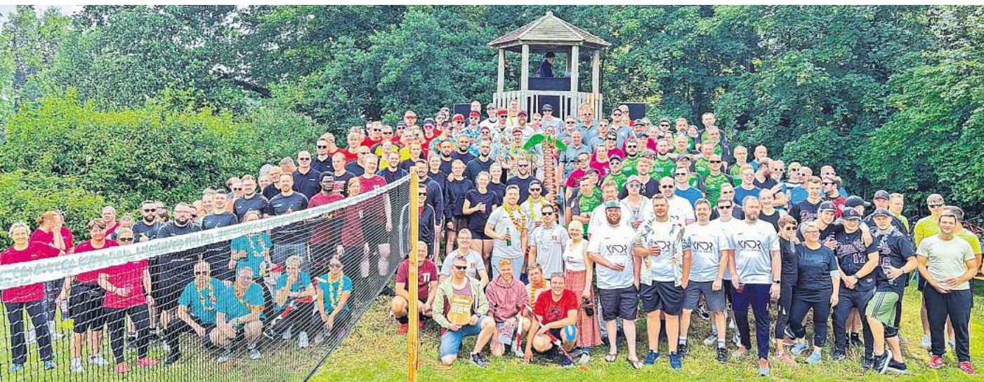
Teilnehmer auf dem Wehminger Indica-Spielplatz.