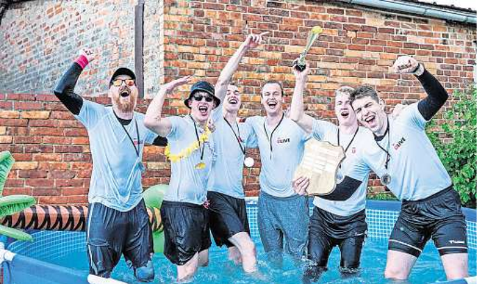
Gewinner der Sir Toby Masters 2024.

ne kurz vor dem Fallrohr lag. Eine Steckleiter wurde an der Hauswand, in Nähe der Katze, aufgestellt. Das Anlocken in eine Transportbox misslang. Die Katze suchte das Weite, wurde nach 15 Minuten von der Besitzerin durch ein Dachfenster in die Wohnung geholt.