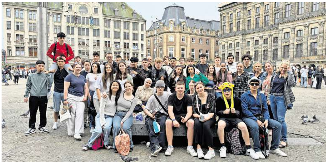
Abschlussfahrt der Realschule Lehrte: Schüler des zehnten Jahrgangs auf dem Marktplatz in Amsterdam.