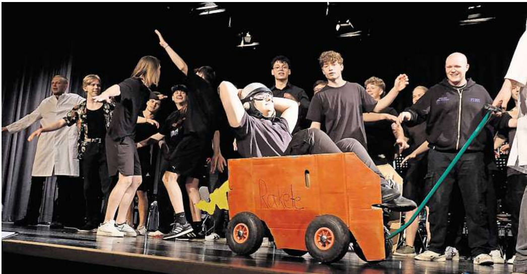
Der Heart Chor mit Show zum Stück "Major Tom".