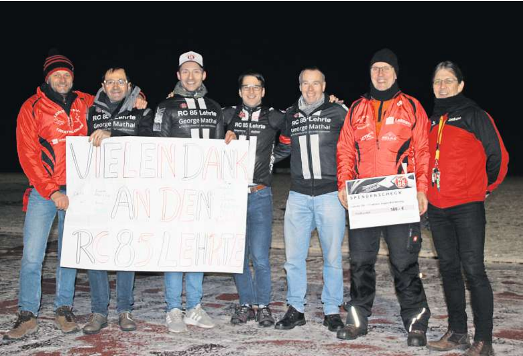
Engagiert für den guten Zweck: Mitglieder des RC 85 bereiten die symbolische Scheck-Übergabe vor.

„Wir freuen uns sehr, dass der RC 85 Lehrte sich für unseren Nachwuchs entschieden hat. Gerade Triathlon ist kein kostengünstiger Sport, sodass jetzt das ein oder andere Equipment besorgt werden kann, oder nach dem harten Radtraining im Sommer mal ein Eis gegessen werden kann“, freuen sich die Trainer der Triathlon-Abteilung. Die Übergabe des Spendenschecks erfolgte im Lehrter Stadion, wo die Kids und Jugendlichen mittwochs von 18 bis 19.30 bei ab-