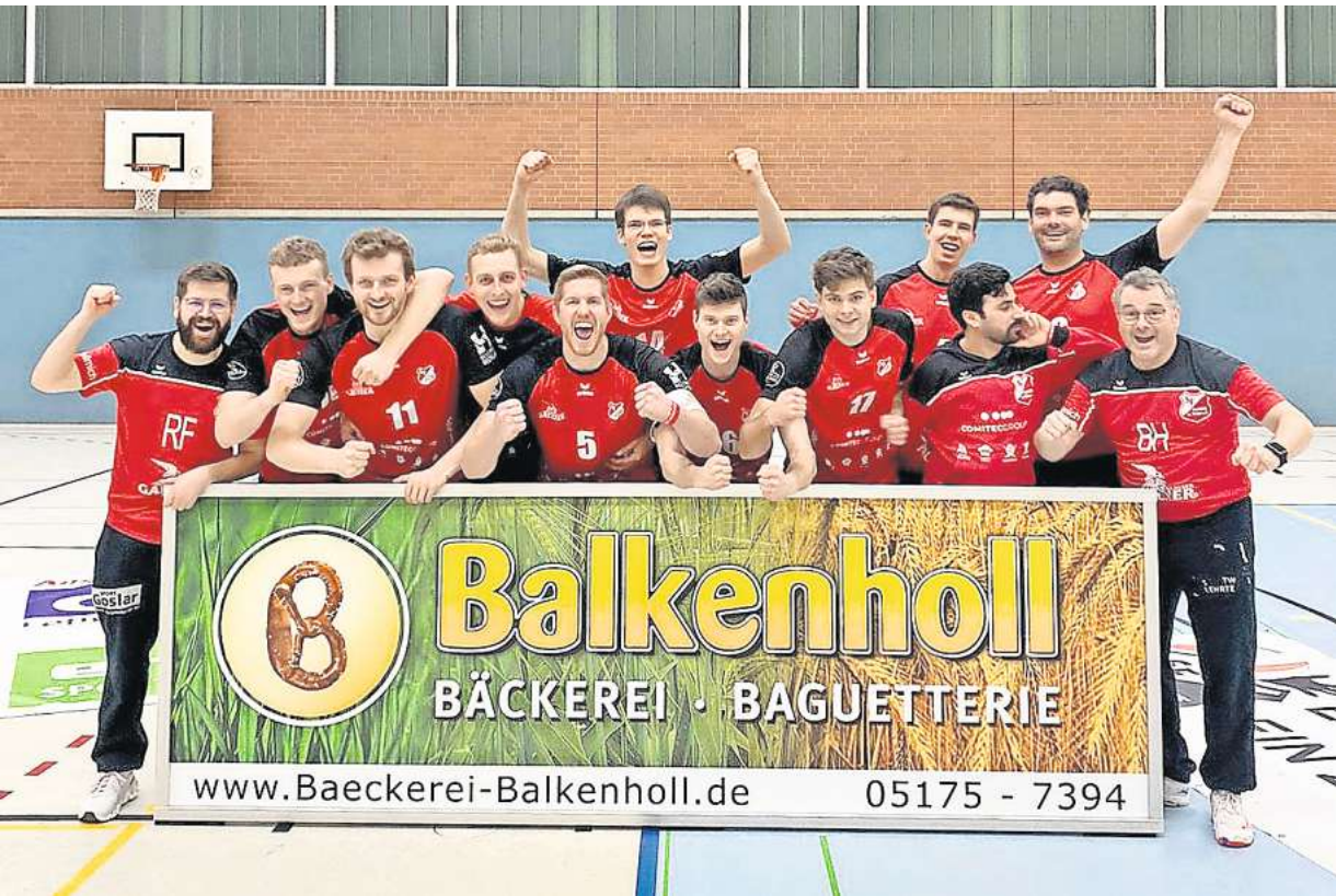
Das Gallier-Team - hier nach seinem Sieg gegen Delbrück - will in die 2. Liga aufsteigen.

dies nicht, hatte Redebedarf und rief sein Team beim Stand von 19:15 und nochmals bei 23:22 zur Auszeit zusammen – dennoch glückte Delbrück zum 23:23 aus. Die Gallier machten darauf den nächsten Punkt und erspielten sich so den ersten Satzball, den die Gäste jedoch ebenso wie sechs folgenden abwehren sollten. Erst der achte Aligser Versuch brachte den entscheidenden Punkt zum 32:30 für die Hausherrn, die im ganzen Satz nur einmal – nämlich beim Stand von 0:1 – im Rückstand lagen.