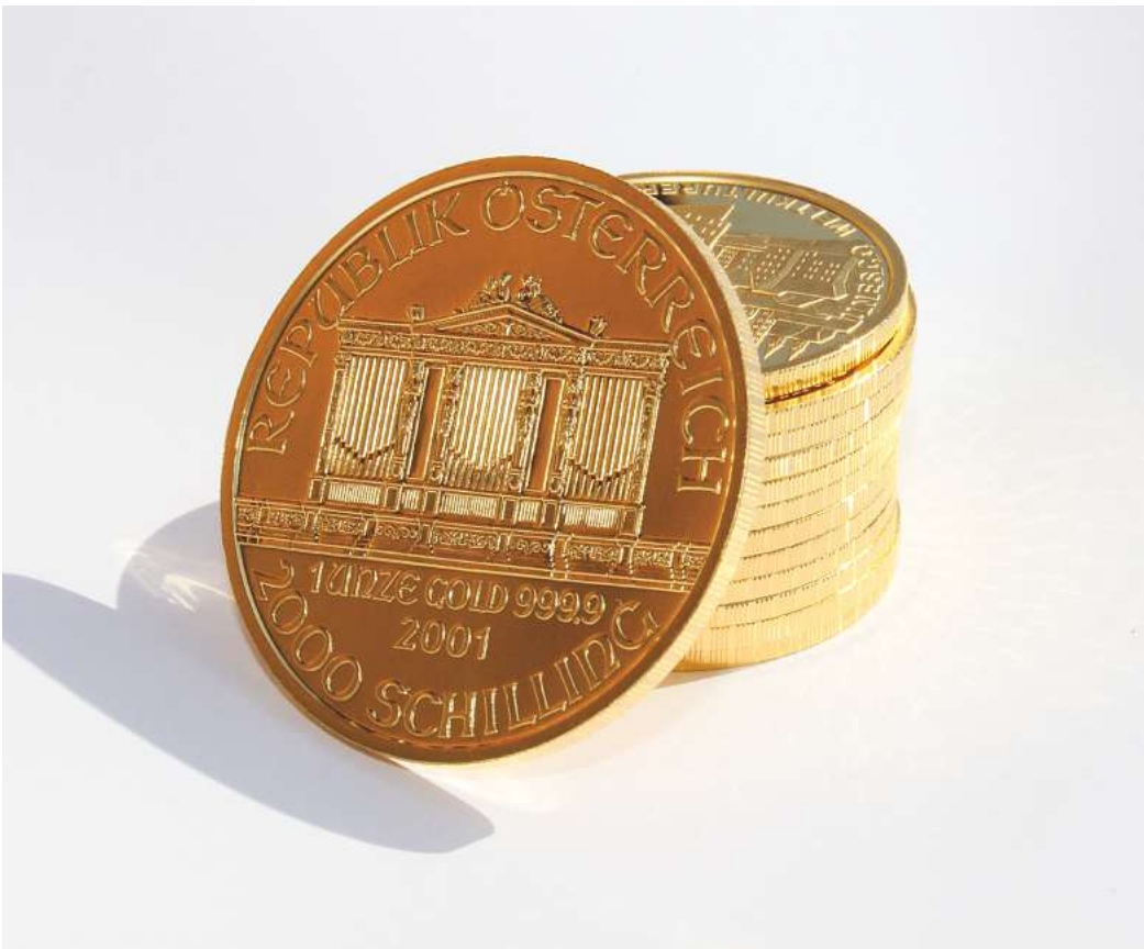
Viele Menschen investieren in Goldmünzen – die 2000-Schilling-Münze Österreich ist aktuell etwa 1.800 Euro wert.