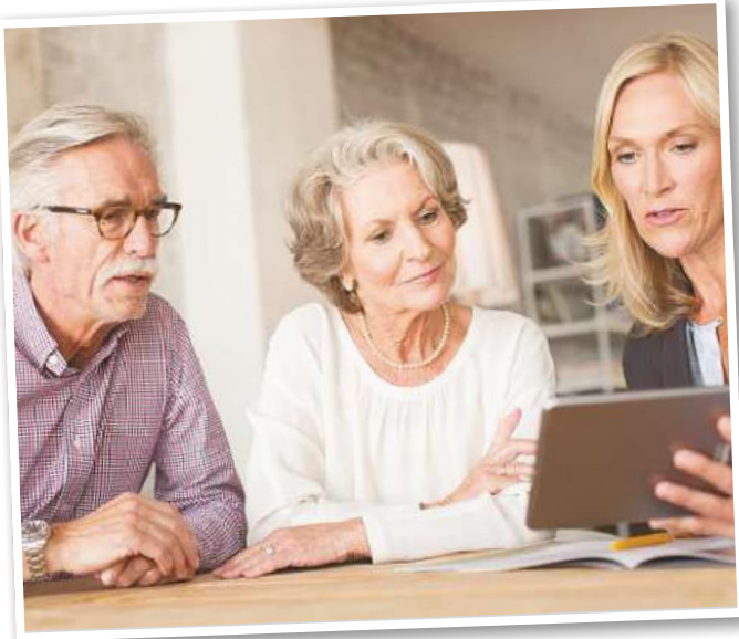
Einige Menschen spezialisieren sich beruflich auf Anlageberatung.

ihrem Beruf und geben diese Vorteile an andere Menschen weiter. Zudem können Finanzberater gutes Geld mit ihrer Tätigkeit verdienen. Denn Finanzberater beraten Privatpersonen, Selbstständige und Ge-