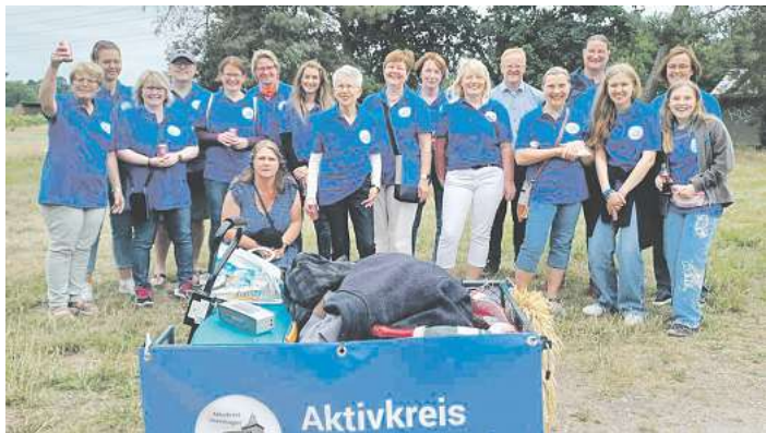
Die Mitglieder des Aktivkreises sind an ihren neuen blauen Poloshirts gut erkennbar.

Neben Leckereien vom Grill, sowie Brezeln und Käsespießen gibt es auch eine Auswahl an alkoholfreien und alkoholischen Getränken. Für gute Stimmung an diesem Abend sorgt ab 18:30 Uhr der Musikzug der Freiwilligen Feuerwehr Ramlingen-Ehlershausen.