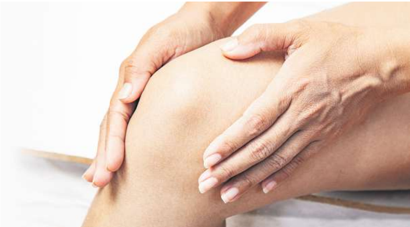
Auf dem Markt gibt es inzwischen ein ganz besonderes CBD Gel, das Menthol und Minzöl zur Pflege beanspruchter Muskeln enthält.