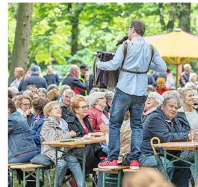
Musik und Tanz im Stadtpark

Donnerstag, 18. Mai, 11.00 bis 15.00 Uhr Musik und Tanz im Stadtpark Stadtpark / Schwanenteich Veranstalter: VVV + Marktspiegel + Studio B 5 + Fitnesspark Burgdorf Tel.: 05136 – 18 62