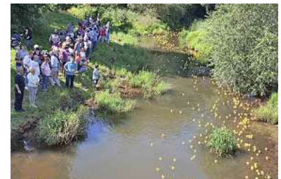
Entenrennen auf der Aue

Samstag, 20. Mai, 11.00 Uhr 14. Entenrennen auf der Aue Auebrücke, Poststraße Veranstalter: Stadtmarketing-Initiative „Ich kauf in Burgdorf“ + E-CENTER-CRAMER + Verein für Kunst und Kultur in Burgdorf Teilnehmerkarten: Bleich Drucken und Stempeln, Braunschweiger Str. 2 + E-CENTER-CRAMER (Weserstraße 2a und Uetzer Straße 14-15) + HAZ/ NP/Marktspiegel (Marktstraße 16)