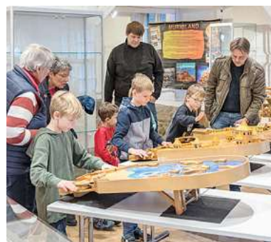
Murmeln-Mitspielausstellung im Stadtmuseum

Sonntag, 7. Mai, 11.00 bis 17.00 Uhr Murmeln-Mitspielausstellung „Auf die Murmeln, fertig los“ im Rahmen der Ausstellung „95 Jahre VVV – 95 Jahre für Burgdorf“ Stadtmuseum, Schmiedestr. 6 Eintrittskarten an der Tageskasse Veranstalter: VVV + Förderverein Stadtmuseum + Stadt Burgdorf