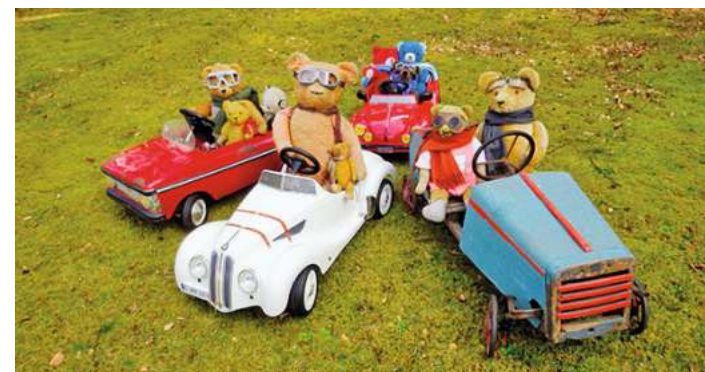
Die große Teddy-Schau

Sonntag, 28. Mai, bis Sonntag, 6. August Ausstellung „Die große Teddy-Schau“ Stadtmuseum, Schmiedestr. 6 Öffnungszeiten: Sonntag von 14.00 bis 17.00 Uhr Veranstalter: VVV + Förderverein Stadtmuseum + Stadt Burgdorf