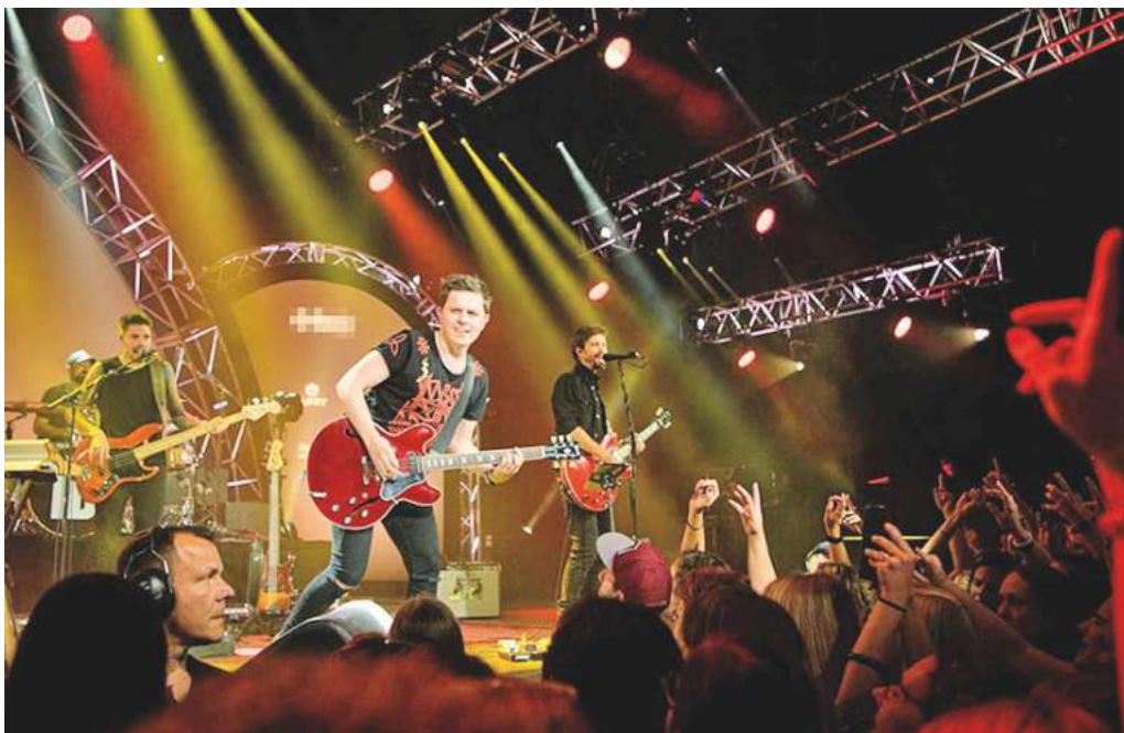
Michael Patrick Kelly tritt auf dem Burgdorfer Schützenplatz auf.

Danach nahm er sich eine Auszeit von sechs Jahren und lebte in Stille als Mönch in einem Kloster