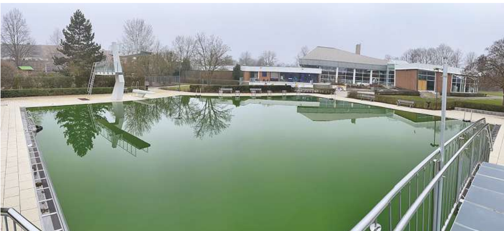
Der milde Winter hat das Wachstum von Algen im Freibad gefördert, jetzt müssen die Beschäftigten das Becken für die Saison putzen.

Burgdorf. Der Montagstreiff, eine Selbsthilfegruppe für Alkohol- und Medikamentenabhängige, lädt zum Kontaktcafé ein. Es beginnt am morgigen Sonntag, 23. April, um 15 Uhr im DRK-Aktiv-Treff, Wilhelmstraße 1b.