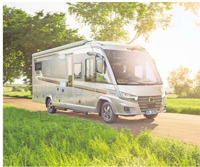
Bietet viel Komfort: Der Carthago e-line von Fiat.

dem Modelljahr 2027 folgt im Juni 2026. Die Unterschrift ist gesetzt. Es geht los.