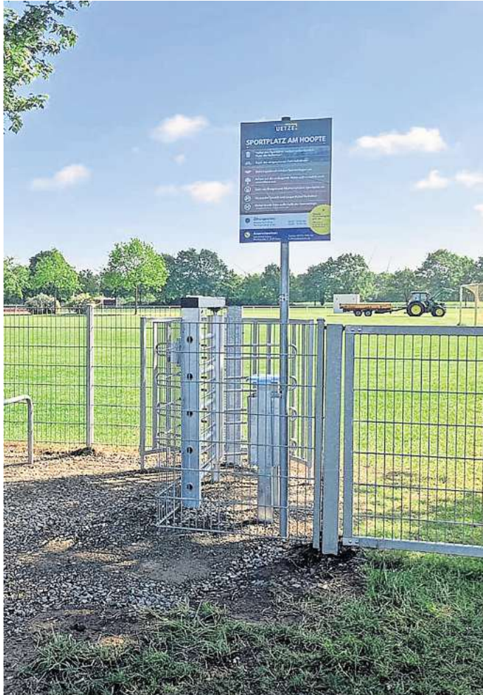
Für die Öffentlichkeit ist der Sportplatz am Herrschaftsweg über ein Drehkreuz zugänglich.

Die Verantwortlichen setzen daher auf das Verantwortungsbewusstsein der Kinder und Jugendlichen sowie auf gegenseitige Rücksichtnahme. Nur so könne gewährleistet werden, dass der Sportplatz dauerhaft in gutem Zustand bleibt und von allen gleichermaßen genutzt werden kann.