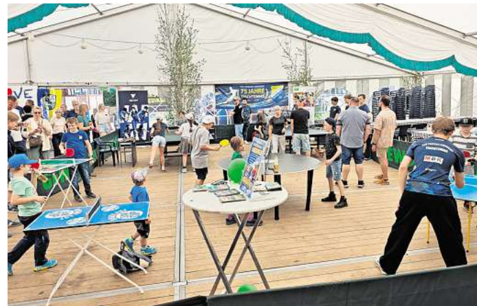
In der Nacht Party, am Tag Tischtennis: Im großen Festzelt ist während des Jubiläums einiges los.

Am Sonntag endete das Jubiläumswochenende schließlich mit einem großen Festumzug der Hänigser Vereine und Verbände. Mehr als 500 Teilnehmer und mehrere Spielmanszüge zogen dabei durch die Straßen und machten noch einmal deutlich, wie lebendig die Dorfgemeinschaft in Hänigsen bis heute ist.