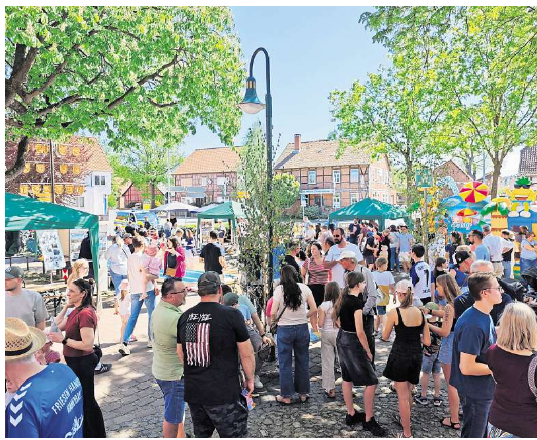
800 Jahre Hänigsen: Hunderte Menschen tummeln sich am Familientag in Hänigsen Dorfmitte, um das Jubiläum zu feiern und die Angebote der vielen Vereine vor Ort auszuprobieren.

bohrung im Jahr 1861. Begleitet wurde der Abend vom Feuerwehrmusikzug Burgdorf-Hänigsen und dem Spielmanszug Riedel, die für gute Stimmung sorgten.