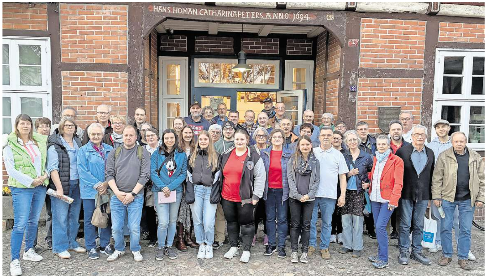
Viele engagierte Dorfbewohner tragen zur 800- Jahr-Feier bei.