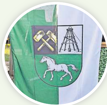
Zur Jubiläumsfeier werden vielerorts die Hänigser Flaggen gehisst.

10.00 Uhr Zeltgottesdienst 11.00 Uhr Frühstück 14.00 Uhr Festumzug 16.00 Uhr Kaffeetafel