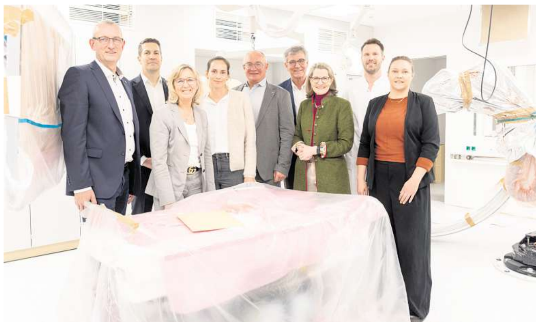
Im Rahmen einer Feierstunde wurden das Herzkatheterlabor und das moderne MRT vorgestellt.

Herzkatheterlabor und MRT stärken Ausbau zum Schwerpunktversorger