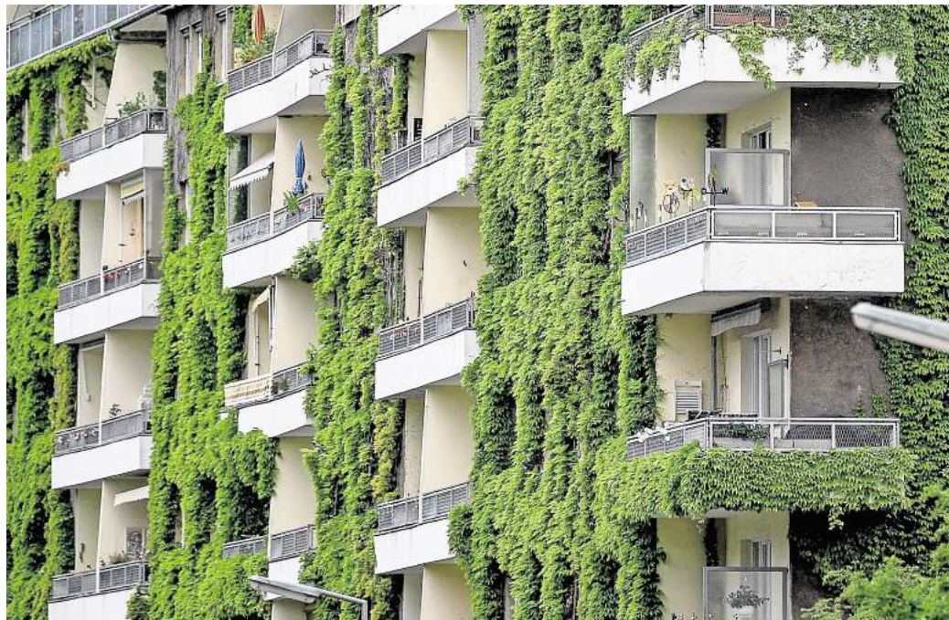
Pflanzen an der Fassade sorgen im Sommer für Schatten und im Winter für zusätzliche Dämmung.

Grundsätzlich gibt es laut dem Verband zwei Formen: Entweder wachsen Kletterpflanzen vom Boden aus an Rankhilfen nach oben, oder es werden Pflanzgefäße direkt an der Fassade befestigt. Für beide Varianten rät der VFF zu einem Fachbetrieb. Auch der Naturschutzbund Deutschland (Nabu) hält den Rat von Fachleuten für