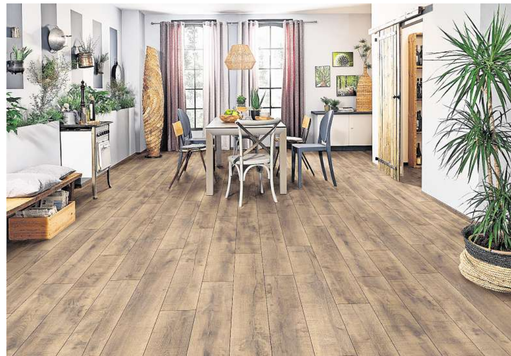
Mit dem richtigen Bodenbelag sind umgekippte Gläser, verschüttetes Gießwasser oder übergeschwapptes Badewasser kein Problem.

scheidenden Vorteil, der bisher nur Fliesen oder Vinyl vorbehalten war. Zusätzlich verhindert wird das Eindringen von Feuchtigkeit durch eine extrastabile Klickverbindung, die zudem eine kinderleichte Verlegung im DIY-Verfahren ermöglicht – und das im Vergleich zu herkömmlichem Laminat sogar auf sehr großen Flächen ohne Dehnungsfuge. Mit Abriebklasse AC5 ist der Boden extrem robust gegen Abrieb und Kratzer und somit auch für viel frequentierte Räume wie Eingangshalle, Wohn- oder Schlafzimmer bestens geeignet. Selbst Wintergärten stellen dank seiner Lichtbeständigkeit und thermischen Stabilität keine Hürde dar. Mit acht attraktiven Holzdekoren, den Maßen 1.288 x 195 mm und seiner geringen Stärke von nur 6 mm fügt sich der zu 100% CO 2 -neutrale Bodenbelag harmonisch in jede Wohnumgebung ein. Nicht umsonst wurde der robuste Boden mit dem Umweltsiegel Blauer Engel ausgezeichnet. (HLC)