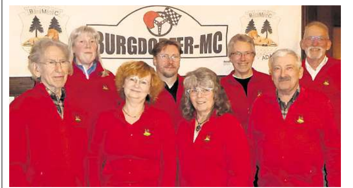
Beim Burgdorfer Motorsportclub bleibt der komplette Vorstand im Amt.

Weitere Infos gibt es auf der Internetseite burgdorfer-mc.de oder per E-Mail an 1.vorsitzender@burgdorfer-mc.de .