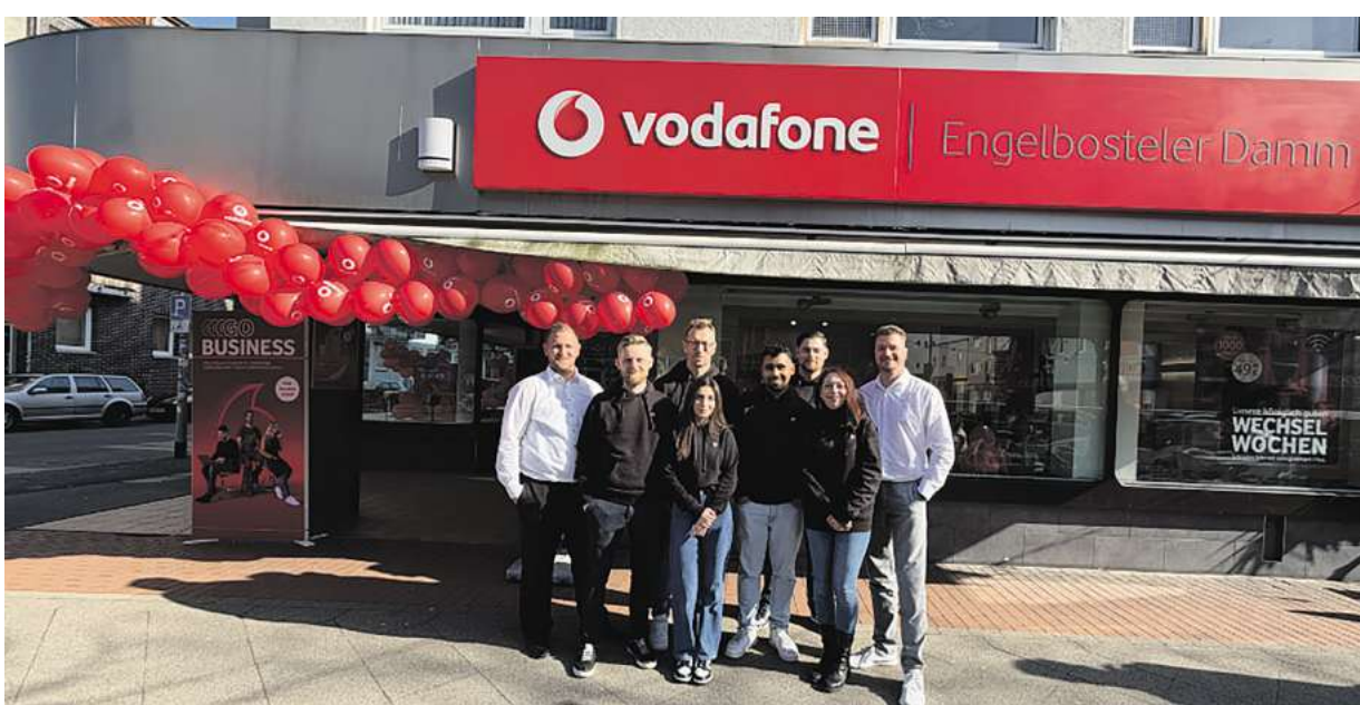
Das neue Team am Engelbosteler Damm freut sich auf neue und bekannte Gesichter.

Ob Privatkunde oder Geschäftskunde – in den modernen Räumen neh-