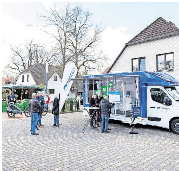
Infomobil mit Beratung unterwegs.

Der Verlauf der neuen Leitung orientiert sich weiterhin überwiegend an der bestehenden Leitung. Anpassungen ergeben sich dort, wo fachliche, rechtliche oder naturschutzfachliche