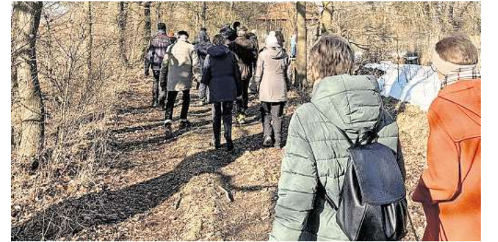
Bei eisiger Kälte und strahlend blauem Himmel wandern die Teilnehmer rund um Dedenhausen.