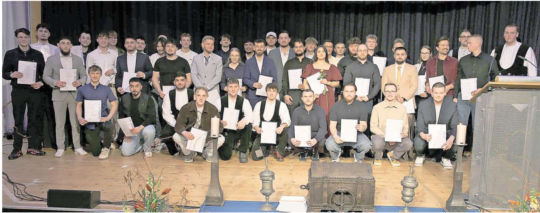
Die Absolventinnen und Absolventen freuen sich über ihre Gesellenbriefe.