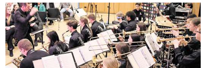
Die Big Band Berenbostel heizt dem Saal ein.