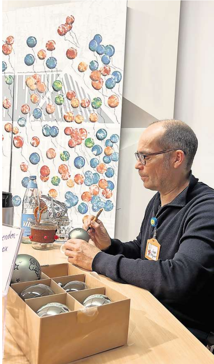
Der Schriftsteller Ingo Siegner bemalt Weihnachtsbaumkugeln.

In einer gemütlichen Leseecke stellte er Auszüge aus seinen Büchern vor und nahm sich anschließend Zeit, um Fragen der Kinder zu beantworten. Geduldig signierte er Bücher, bemalte Weihnachtsbaumkugeln und plauderte mit kleinen wie großen Fans über das Schreiben, Figurenentwicklung und die Freude am Lesen.