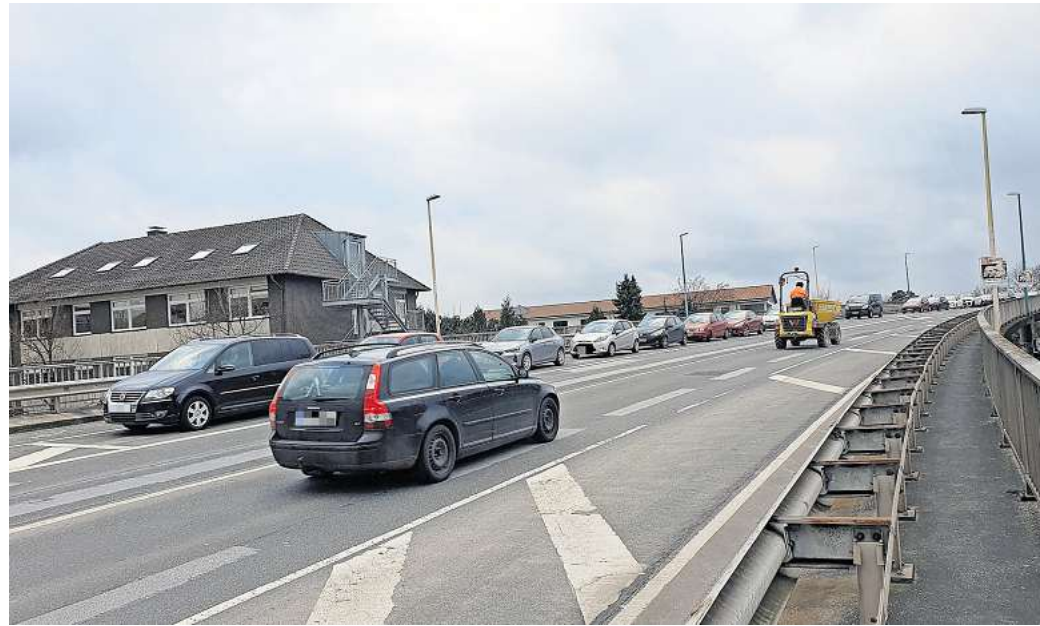
Die Burgdorfer Hochbrücke von 1974 hat Korrosionsschäden. Sie ist zwar nicht akut einsturzgefährdet, muss aber neu gebaut werden.

Ein Gutachten zur Standfestigkeit und Restnutzungsdauer empfiehlt den Brücken-Neubau über die Bahnstrecke – eine logistische Herausforderung