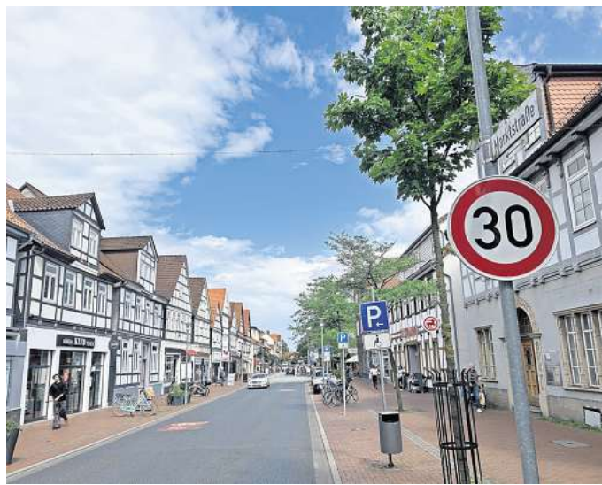
Wenn die Hochbrücke gesperrt werden muss, hätte das negative Auswirkungen auf die Marktstraße.

Um Zeit zu gewinnen für eine Entscheidung mit dieser Tragweite, liegt für nächstes Jahr folgender Vorschlag der Politik auf dem Tisch: Eine Sanierung des asphaltierten Straßenbelags der Hochbrücke für etwa 1,2 Millionen Euro. Dadurch würde Burgdorf etwa zehn Jahre Zeit gewinnen, in der neu gebaut werden kann, wie und wo auch immer. Im Januar will die Stadt eine Machbarkeitsstudie einholen –