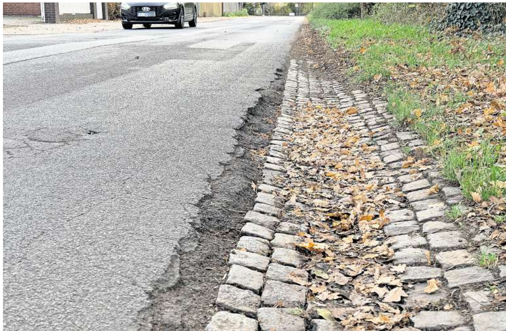
Reichlich kaputt und gefährlich: Die Region Hannover will die Schwüblingser Ortsdurchfahrt sanieren. Aber erst dann, wenn entlang der K 125 ein Radweg gebaut werden kann.

Erst dann erfolgt auch die Instandsetzung der kaputten Schwüblingser Ortsdurchfahrt.