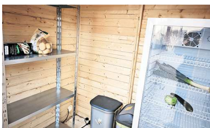
Lebensmittel-Tauchbörse: Im Fairteiler-Häuschen auf dem Spittaplatz gibt es Regale und auch einen Kühlschrank. Auch die Mülltüren werden regelmäßig geleert.

Das Prinzip, nach dem das „Food-Sharing“ (Lebensmittel-Verteilen) funktioniert, ist im Prinzip nicht neu. Neben der Tafel bieten auch in Burgdorf einige Supermärkte Lebensmittel,