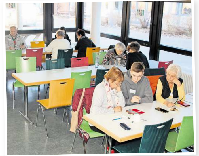
Im November bieten der Seniorenbeirat und das Team Jugend wieder eine Smartphone-Schulung an. Auch bei der Seniorenmesse geben Schüler den Besuchern Tipps für den Umgang mit dem Handy.