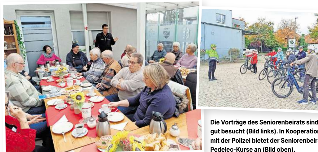
Die Vorträge des Seniorenbeirates sind gut besucht (Bild links). In Kooperation mit der Polizei bietet der Seniorenbeirat Pedelec-Kurse an (Bild oben).

Ein besonderes Augenmerk richtet der Seniorenbeirat auch auf