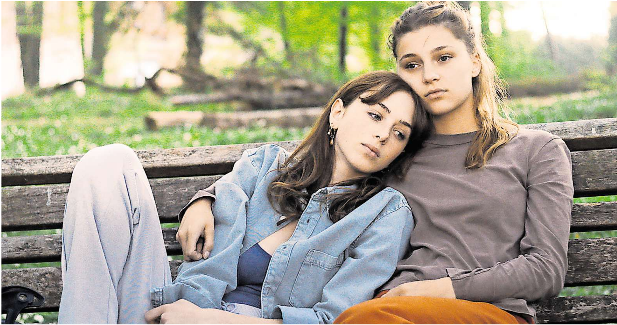
Szene aus „Rivière“.

magaScene Veranstaltungstipp: QUEERE FILMKUNST im Kino im Künstlerhaus