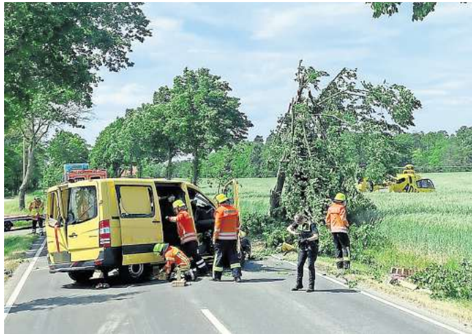
Tödlicher Unfall im Mai 2024 auf der B188: Das Statistische Bundesamt zeigt im Unfallatlas, wo besondere Gefahrenstellen liegen.

Ein zweiter Blick offenbart aber auch, dass sich viele Unfälle, speziell auch in Zusammenhang mit Fußgängern und Radfahrern mitten in der Ortschaft Uetze ereignen. Allein dort wurden auf den Straßen 19 Menschen verletzt. Als Schwerpunkte sind dabei die Burgdorfer Straße und die Kaiserstraße