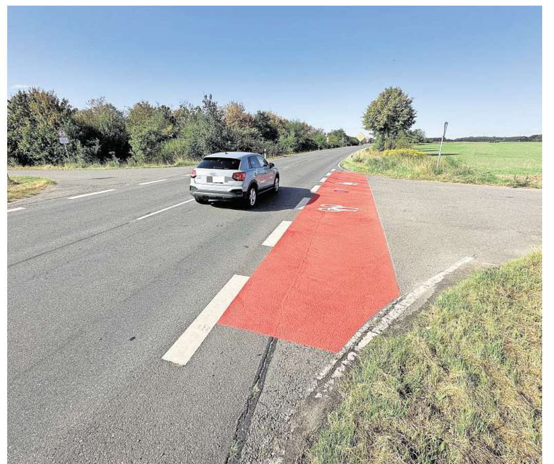
Irrtum: Hier wird vorerst an der Landesstraße 387 in Dollbergen kein Radweg entstehen. Die Piktogramme sind so versehentlich aufgetragen worden.

„Aber wo Menschen arbeiten, können auch Fehler passieren“, wirbt Gahre um Verständnis. Geplant waren vielmehr Piktogramme auf dem landwirtschaftlichen Weg zwischen Dollbergen und Katensen und dann weiter Richtung Uetze, die da-