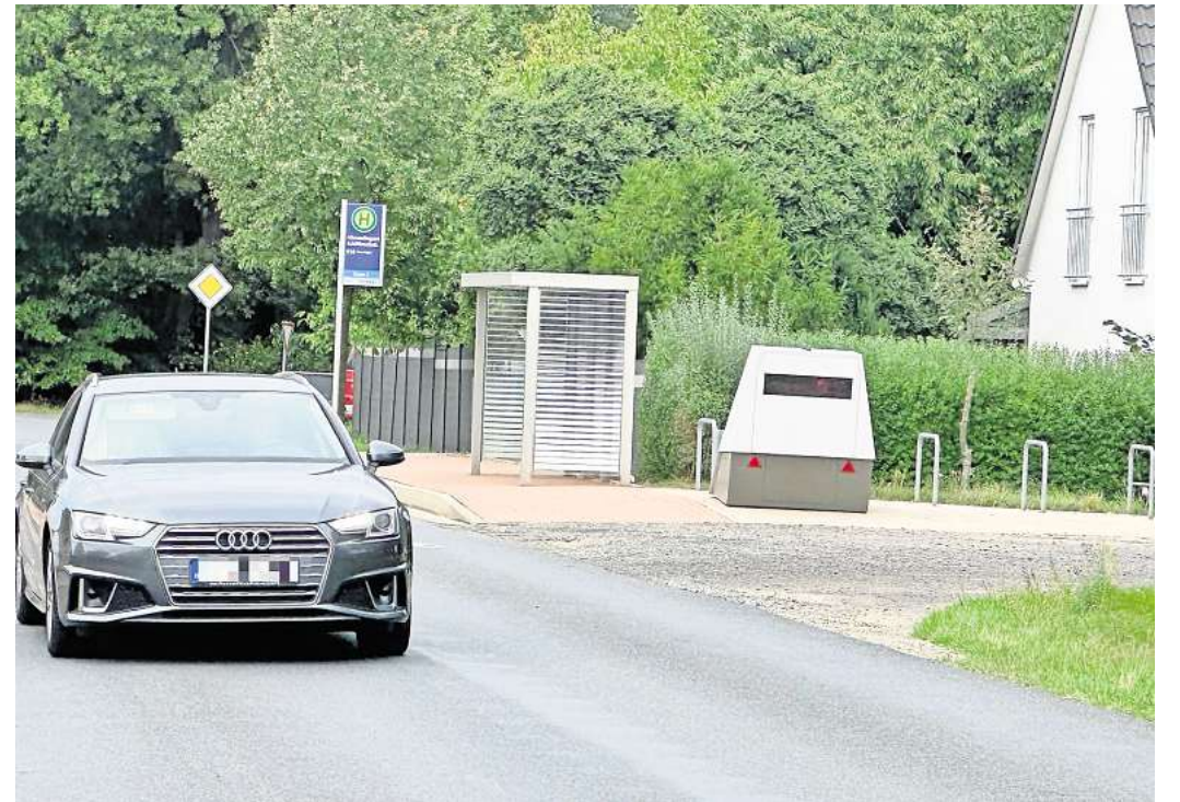
Bunt statt grau: Der gemeindeeigene Blitzer-Anhänger namens Flitzi-Blitzi soll für mehr Verkehrs-erziehung von Kindern farblich gestaltet werden.