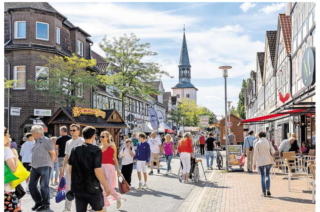
Viele Besucher bummeln bei traumhaftem Spätsommerwetter durch die Innenstadt.

„Das Konzept hat sich wieder voll ausgezahlt – die Besucherzahlen waren erfreulich hoch und die Rückmeldungen durchweg