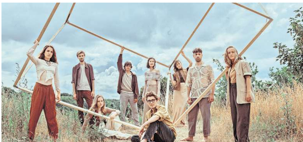
Die hannoversche A Cappella-Formation „neilon“ tritt erstmals in Burgdorf auf.