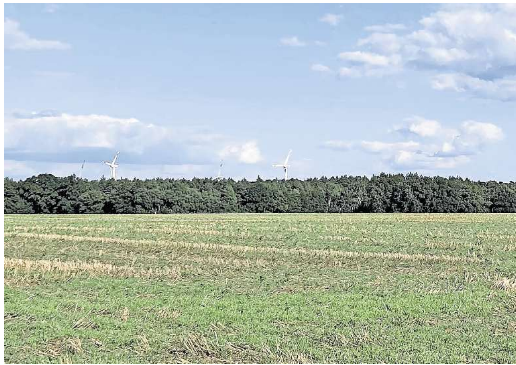
Sollen Zuwachs bekommen: Südlich der L311 bei Dachtmissen finden sich bereits Windräder. Acht weitere Anlagen sollen folgen.

Ein Netzanschluss ist in Zu-sammenarbeit mit der Firma Avacon bereits reserviert. Wie lange es dauert, die Anlagen zu bauen, kann laut Merchant ak-tuell noch nicht gesagt werden. „Das hängt von vielen individu-ellen Faktoren ab, wie beispiels-weise der Bodenbeschaffenheit“, sagt sie. Bei weichem Bo-