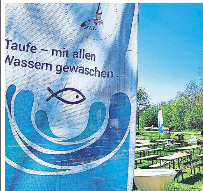
Die Burgdorfer Kirchengemeinden laden auch in diesem Jahr wieder zu einem Tauffest in den Taufwald nach Sorgensen ein.

Kirchengemeinden laden in den Taufwald ein