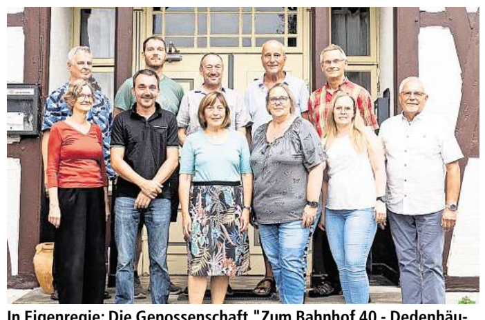
In Eigenregie: Die Genossenschaft "Zum Bahnhof 40 - Dedenhäuser Zukunft eG" betreibt die Gaststätte Zum Bahnhof jetzt in Eigenregie.

DEDENHAUSEN (bud). Während immer mehr Gaststätten und Kneipen schließen, macht das Gasthaus „Zum Bahnhof“ in der kleinen Uetzer Ortschaft Dedenhausen eisern weiter. Zu verkaufen ist das dem Engagement der Bürgergenossenschaft Zum Bahnhof 40 – Dedenhäuser Zukunft e. G., die das 130 Jahre alte Gebäude im Jahr 2022 gekauft hat. Die Geschicke der Gaststätte leitet die Genossenschaft seit November 2023 in Eigenregie. Knapp zwei Jahre später möchte sie nun den nächsten Schritt gehen.