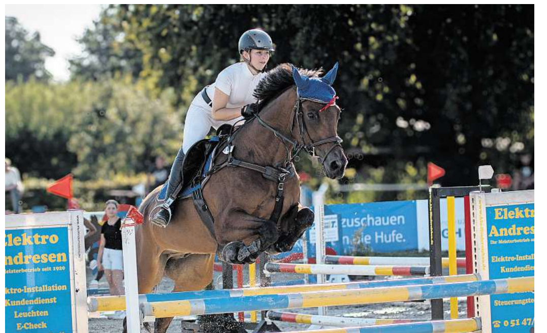
Der Reit- und Fahrverein Hänigsen richtet wieder ein Turnier aus.

HÄNIGSEN (r/fh). Der Reit- und Fahrverein Hänigsen und Umgegend lädt zu seinem diesjährigen Turnier ein. Es findet vom 22. bis 24. August auf der Vereinsanlage, Hoher Weg 12, statt. Auf dem Programm stehen drei Tage voller sportlicher Highlights, darunter Dressurprüfungen bis zur Klasse S* sowie Springprüfungen bis zur Klasse M*. Der Eintritt ist frei. Es stehen Getränke, Kuchen und herzhafte Speisen zum Verkauf bereit, auch zum Mitnehmen. Das große Zelt und zahlreiche Sitzmöglichkeiten direkt am Turnierplatz laden zum Zuschauen, Verweilen und Mitfeiern ein. Für Kinder und Junggebliebene wird ein Hobby-Horsing-Parcours aufgebaut. Außerdem findet am Samstagabend, 23. August, ab 21 Uhr ein Bullriding statt.