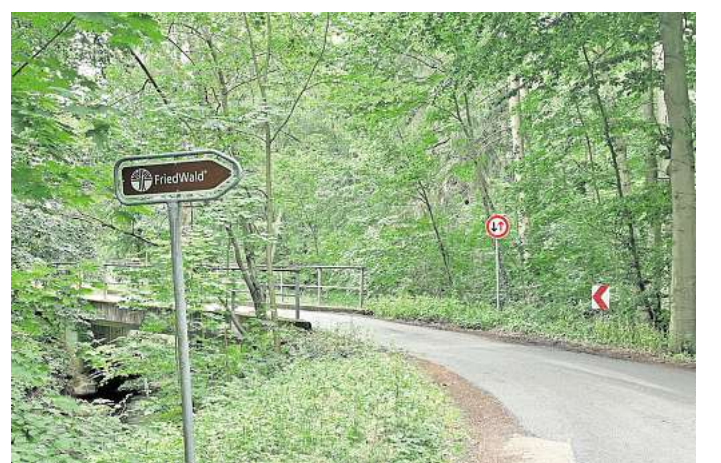
Eins mit der Natur werden: Der Friedwald Uetzer Herrschaft wurde im Juni 2007 eröffnet und erstreckt sich über 65 Hektar.

unternehmens. Noch einmal günstiger sind Baumbestattungen auf dem Uetzer Friedhof. Dem Bestattungsinstitut am Thielenplatz zufolge kostet ein Platz samt Bestattung dort knapp über 1000 Euro. Im Vergleich dazu bewegen sich die Kosten für Erdbestattungen im Schnitt bei 7000 bis 9000 Euro. Der Friedwald Uetzer Herrschaft wurde am 28. Juni 2007 eröffnet und erstreckt sich über eine Größe von 65 Hektar. Für Bestattungen kann hier aus den Bäumen Ahorn, Buche, Eiche, Hainbuche oder auch Lärche gewählt werden. Im Friedwald ist es möglich, sich einzeln, zu zweit, im Kreis der Familie oder neben Freundinnen und Freunden beerdigen lassen. Der Sternschnuppenbaum steht Eltern zur Verfügung, deren Kinder bis zum dritten Lebensjahr oder in einem Hospiz verstorben sind. Die Asche der Verstorbenen darf nur in biologisch abbaubaren Urnen an den Wurzeln von