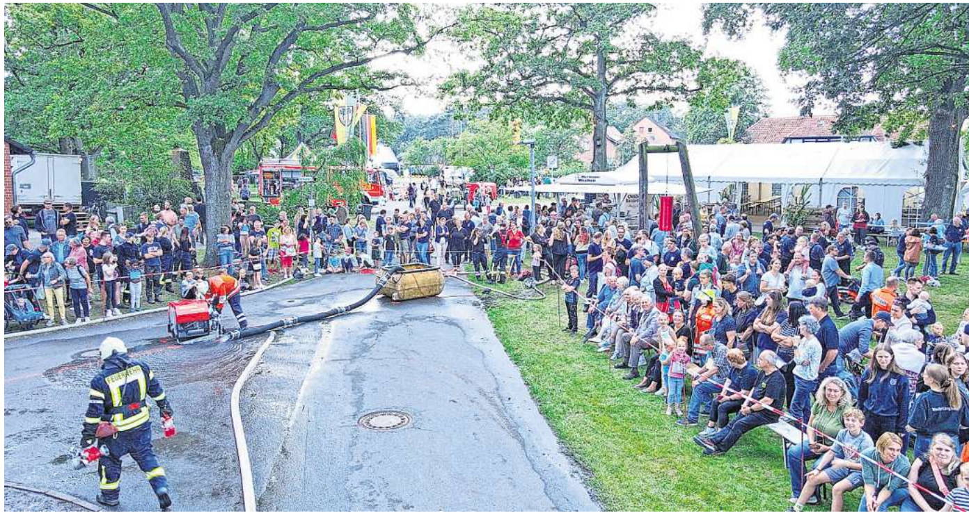
Pure Spannung: Im vergangenen Jahr fieberten viele Zuschauer mit ihren Mannschaften mit.

Um 13 Uhr beginnt der Wettkampf nach „Heimberg und Fuchs“, auch bekannt als „Eimerfestspiele“. Für den Aue Cup stellt jede Feuerwehr ein Team aus einem Maschinisten, einem Melder und sogenannten Angriffs-, Wasser- und Schlauchtrupps. Gemeinsam wird dann ein Löschangriff samt Pumpe, Verteiler und Schläuchen aufgebaut, um schlussendlich drei Eimer mit einem Wasserstrahl zu Fall zu bringen.