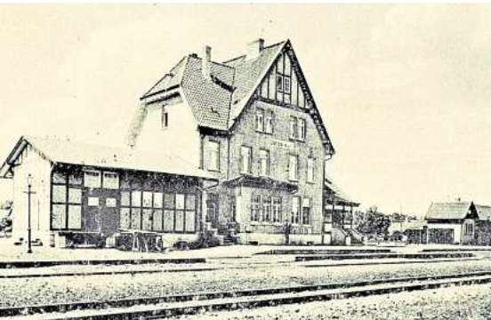
Dieses historische Foto zeigt, wie der Uetzer Bahnhof einst ausgesehen hat.