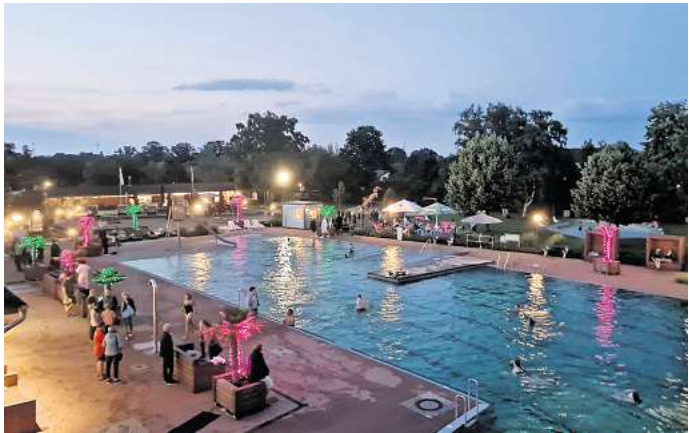
Das Mitternachtsschwimmen bietet eine besondere Atmosphäre.

Veranstaltung im Naturerlebnisbad mit Lichteffekten und Live-Musik