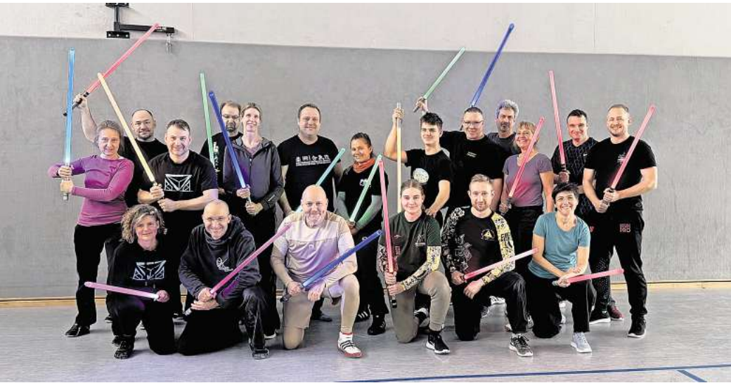
Bei einem Workshop haben Mitglieder des Samurai Burgdorf den Showkampf mit Lichtschwertern kennengelernt.

Blaschke führte die Gruppe mit viel Fachwissen und Geduld durch die Grundlagen des Showkampfes. Neben klassischen Angriffs- und Abwehrtechniken standen auch spektakuläre Elemente wie Drehun-