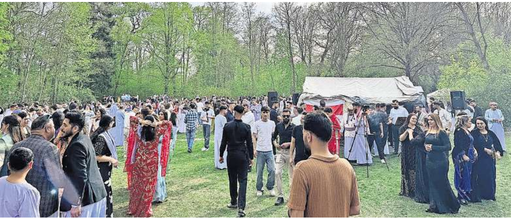
Mehr als 1500 Besucherinnen und Besucher haben im Burgdorfer Stadtpark das Jesidische Neujahrsfest gefeiert.

und Zusammenhalt steht“, so Baran. Viele der Teilnehmenden betonten im Laufe des Tages, wie besonders und verbindend das Fest für sie gewesen sei.