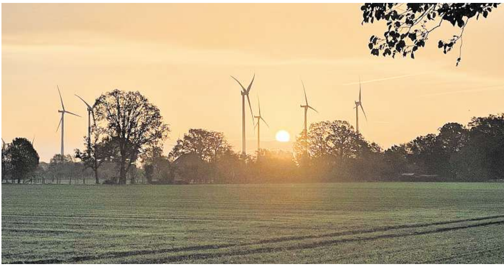
Weitere Anlagen, wie hier in Uetze, sind nötig: Die Windkraft ist ein wichtiger Bestandteil auf dem Weg zur Klimaneutralität.