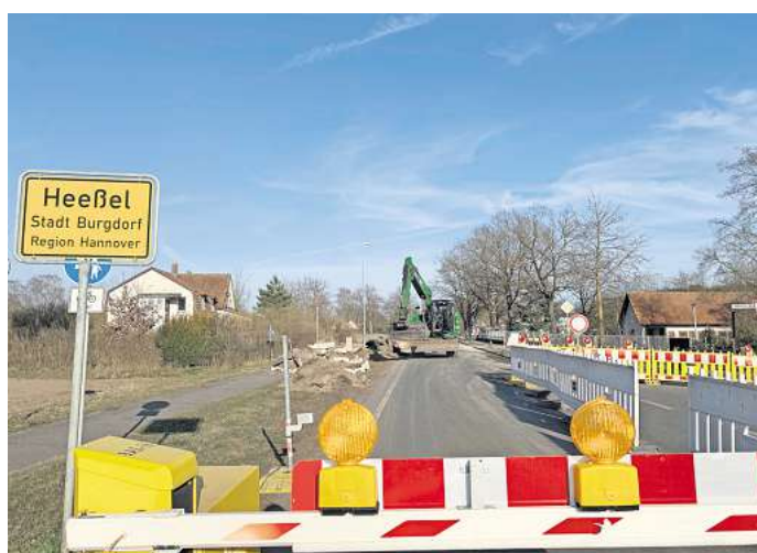
Sanierung K112: Arbeiter heben mit einem Bagger den Seitenstreifen aus.

Nachdem die Arbeiter den Haftkleber auf die Fahrbahn angebracht haben, soll der Ab-