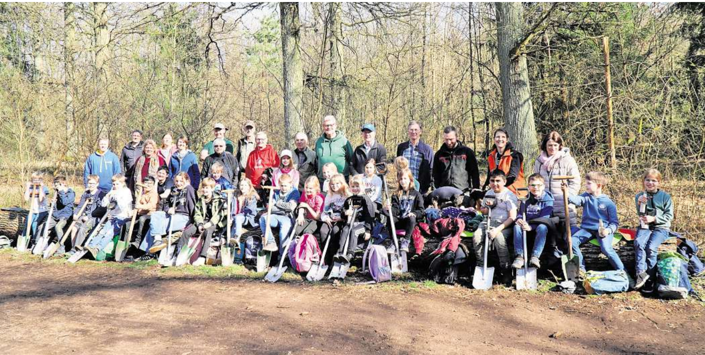
Freuen sich über die erfolgreiche Pflanzaktion im Burgdorfer Holz: die Drittklässler von der Astrid-Lindgren-Grundschule zusammen mit ihren Lehrerinnen, den Vertretern des Forstamts Fuhrberg und Mitgliedern des Rotary-Clubs.

Drittklässler der Astrid-Lindgren-Grundschule pflanzen im Burgdorfer Holz junge Bäume