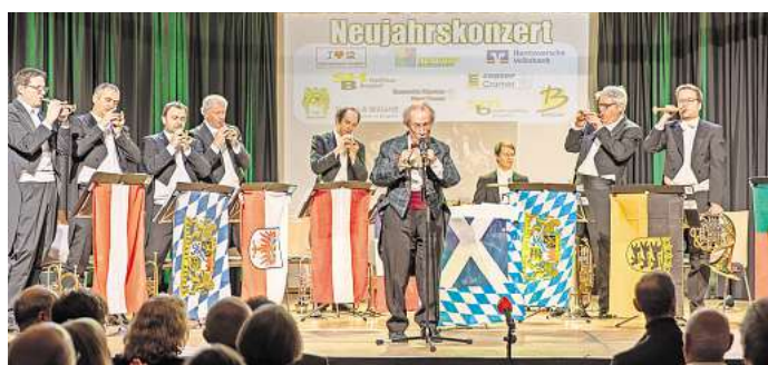
Das Ensemble "Blebschaden" hat beim Neujahrskonzert mit ungewöhnlichen Arrangements überrascht.

BURGDORF (r/fh). Beim Neujahrskonzert im Burgdorfer Stadthaus hat das Publikum überraschende Arrangements mit Witz und Virtuosität erlebt. Zwischen den Musikstücken griff der Leiter Bob Ross großzügig in die Humor-Kiste und sorgte mit seinen launigen Moderationen für viele Lacher. Bevor sich die Musiker verabschiedeten, spielten sie auf Wunsch der