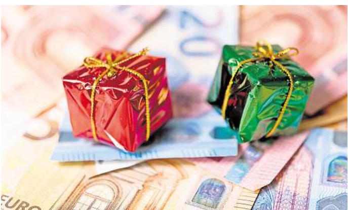
Nicht alles einplanen: Knapp die Hälfte des Weihnachtsgeldes geht durch Steuern und Sozialabgaben weg.

Das ist genau der Betrag, der dem Mann an Steuern von seinem Weihnachtsgeld einbehalten wird. Abgezogen werden zudem die Sozialversicherungsbeiträge, die auch auf das Weihnachtsgeld zu leisten sind. * Die Beiträge für Kranken-, Renten-, Arbeitslosen- und Pflegeversicherung addieren sich in dem Beispiel auf rund 21 Prozent. * Was das Weihnachtsgeld um weitere 420 Euro schmälert. Bleiben am Ende von der 2.000 Euro-Sonderzahlung also nach Abzug der 487 Euro Lohnsteuer und der 420 Euro Sozialabgaben noch rund 1.093 Euro übrig. Der VLH zufolge brauchen es Arbeitnehmerinnen und Arbeitnehmer gar nicht un-