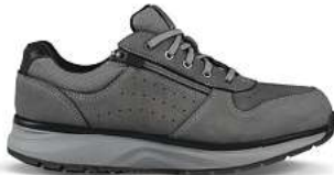
Dynamo ZIP dark grey

L. Kay: Mit der Wahl des richtigen Schuhs sollte sich grundsätzlich jeder auseinandersetzen. Insbesondere jedoch Menschen, die berufsbedingt oder in der Freizeit viel Gehen oder Stehen, bieten Joya Schuhe optimale Entlastung und Prävention von Fehlstellungen, Verletzungen und den damit verbundenen Beschwerden. Auch Ärzte und Therapeuten empfehlen Joya Schuhe bei Rücken- und Gelenkproblemen und setzen sie erfolgreich bei verschiedenen Beschwerden des Bewegungsapparates ein.