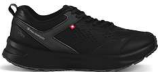
Veloc SR black